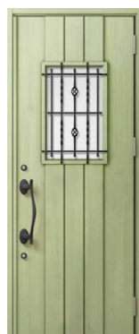
D43型 リーフグリーン