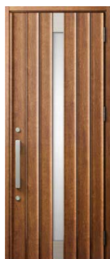
P16型 ハンドダウンチェリー