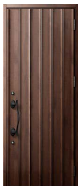
D11型 アンティークオーク