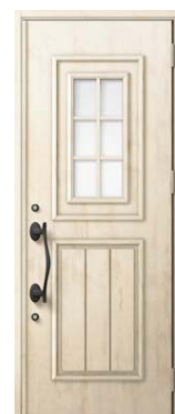
C12型 エクリュアイボリー