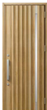
P12型 シュガーオーク