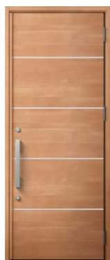
M16型 ミディアムチェリー