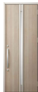
M22型 グレイッシュオーク